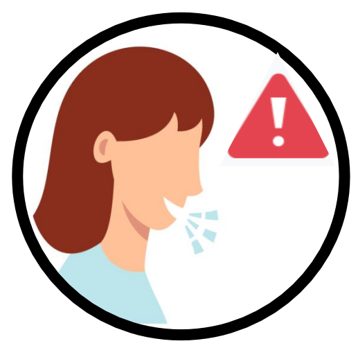
කෙළ ගැසීමෙන් වැළකී සිටින්න