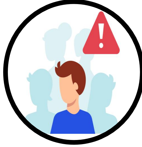
සෙනඟ ගැවසෙන ස්ථාන මඟහරින්න