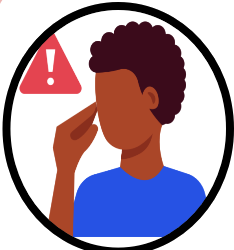
මුහුණ ඇල්ලීමෙන් වැළකී සිටින්න