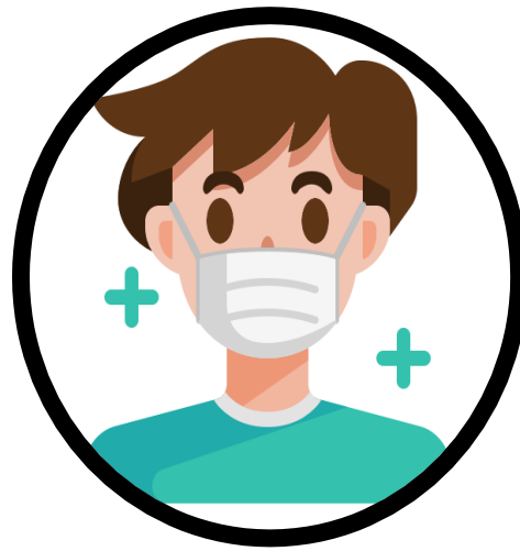
මුඛ ආවරණයක් පළදින්න