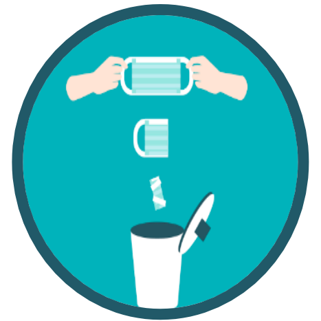
මුඛ ආවරණ නිසියාකාරව බැහැර කරන්න