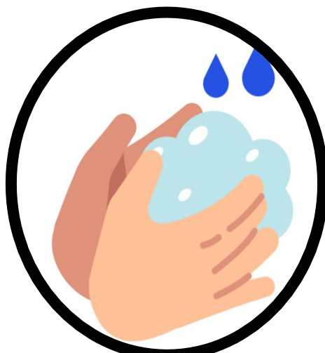
සබන් දමා තත්පර 20ක් අත් සෝදන්න