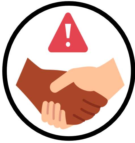
අතට අත දීමෙන් වැළකී සිටින්න